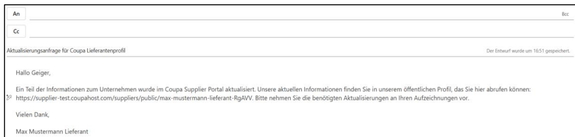
Abbildung 6: Beispiel-E-Mail zur Änderung der Unternehmensdaten

Sie erhalten eine E-Mail-Benachrichtigung, sobald die Änderungen von der Geiger-Gruppe genehmigt wurden.